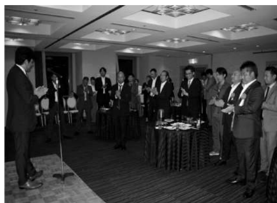
光友ブロック長あいさつ