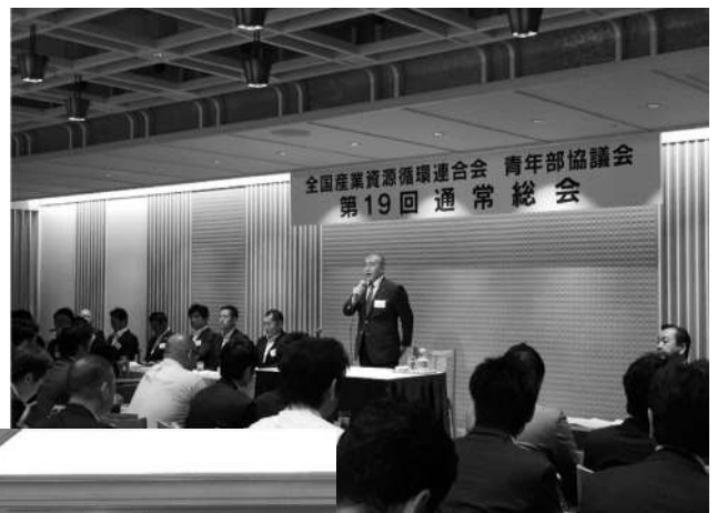
全産連青年部協議会会長 あいさつ